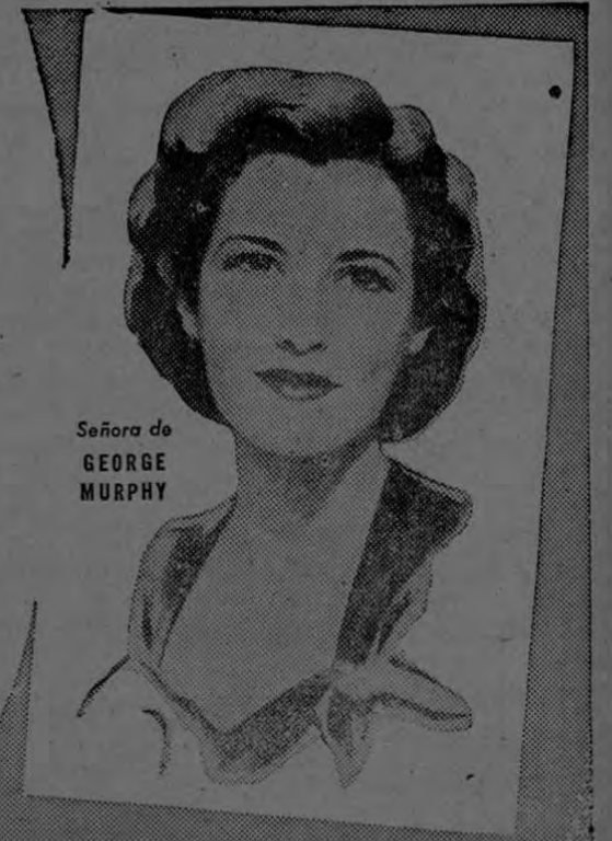
Señora de GEORGE MURPHY

Distribuidores: SANTIAGO PALACIOS, Sucs., San José